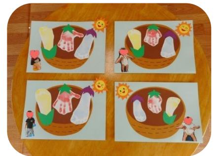
お楽しみのおやつタイム🍰🍪